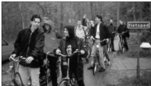
— Hongaren en Nederlanders fietsend op Texel