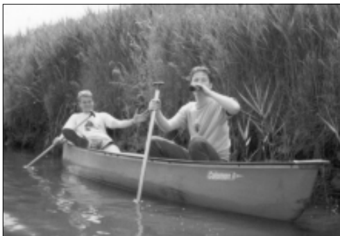
— Kanomiddag met de ActiviteitenCommissie