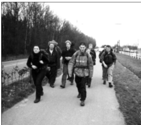
— Op weg tijdens het Wandelweekend