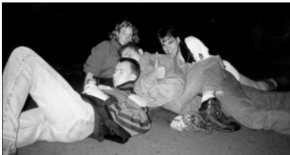
— Even uitrusten tijdens zo een dropping